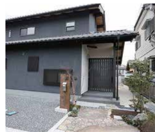
和モダンの落ち着いた佇まい。アプローチも一緒に提案