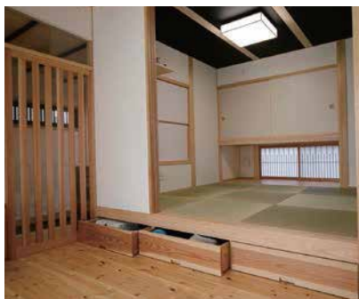
風通しのことまで計算された和室

障子を開ければ、リビングと一体化。心地よい風が通り抜けるように地窓を設けたり、床下収納をつかったり。快適な暮らしを叶える工夫が随所に。