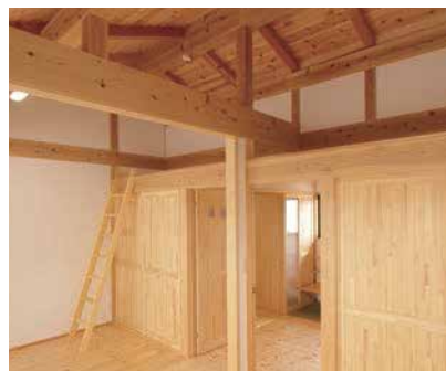
未来を見据えた子ども部屋

障子を開ければ、リビングと一体化。心地よい風が通り抜けるように地窓を設けたり、床下収納をつかったり。快適な暮らしを叶える工夫が随所に。