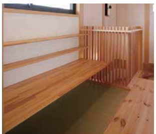
2階ホールに設けられた畳敷きの書齋