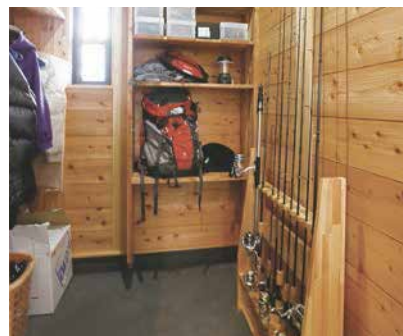
収納力の高さも嬉しい、土間の玄関収納

2階にある広々とした子ども部屋。将来、子どもが増えた時など、家族の成長に合わせて仕切れば、2つの個室にスペースを分けることができます。