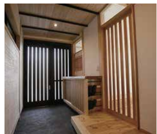
存在感のある無垢の一枚板の下駄箱。側面にはスリッパラックも