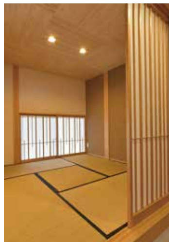
ゆったりくつろげる小上がりの和室